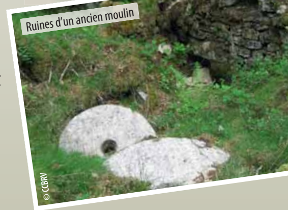
Ruines d'un ancien moulin

Depuis longtemps, l'homme a façonné le paysage du site. Les traces des anciennes pratiques paysannes sont encore présentes tout au long du sentier (ruines de moulins, digue d'étang, levades, fosses d'extraction de tourbe, ...). Soyez attentifs et observez comment l'homme a mis à profit les différentes ressources du site.