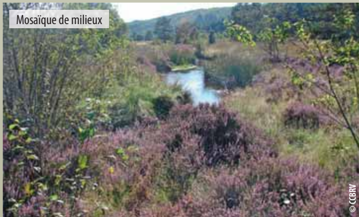
Mosaïque de milieux