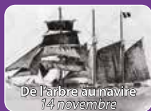
De l'arbre au navire 14 novembre