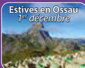
Estives en Ossau 1 er décembre