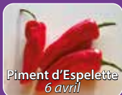
Piment d'Espelette 6 avril