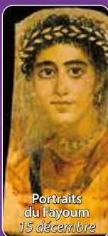
Portraits du Fayoum 15 décembre