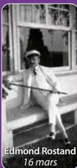
Edmond Rostand 16 mars