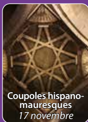
Coupoles hispano-mauresques 17 novembre