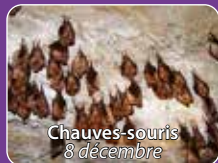
Chauves-souris 8 décembre