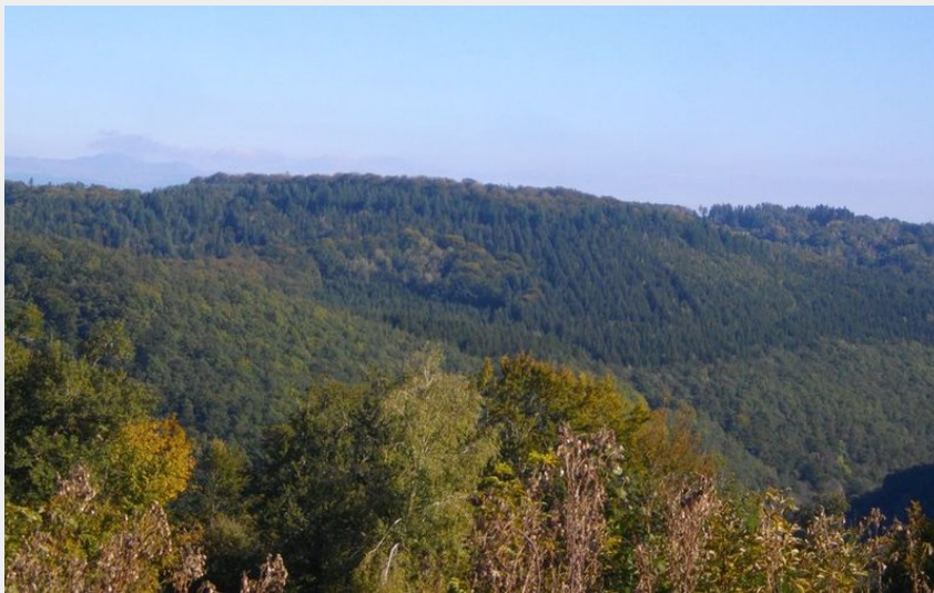
(G.Salat - CC HCC)