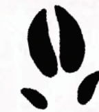
Trace de sanglier