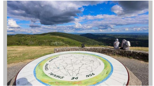
Table d'orientation au Suc au May