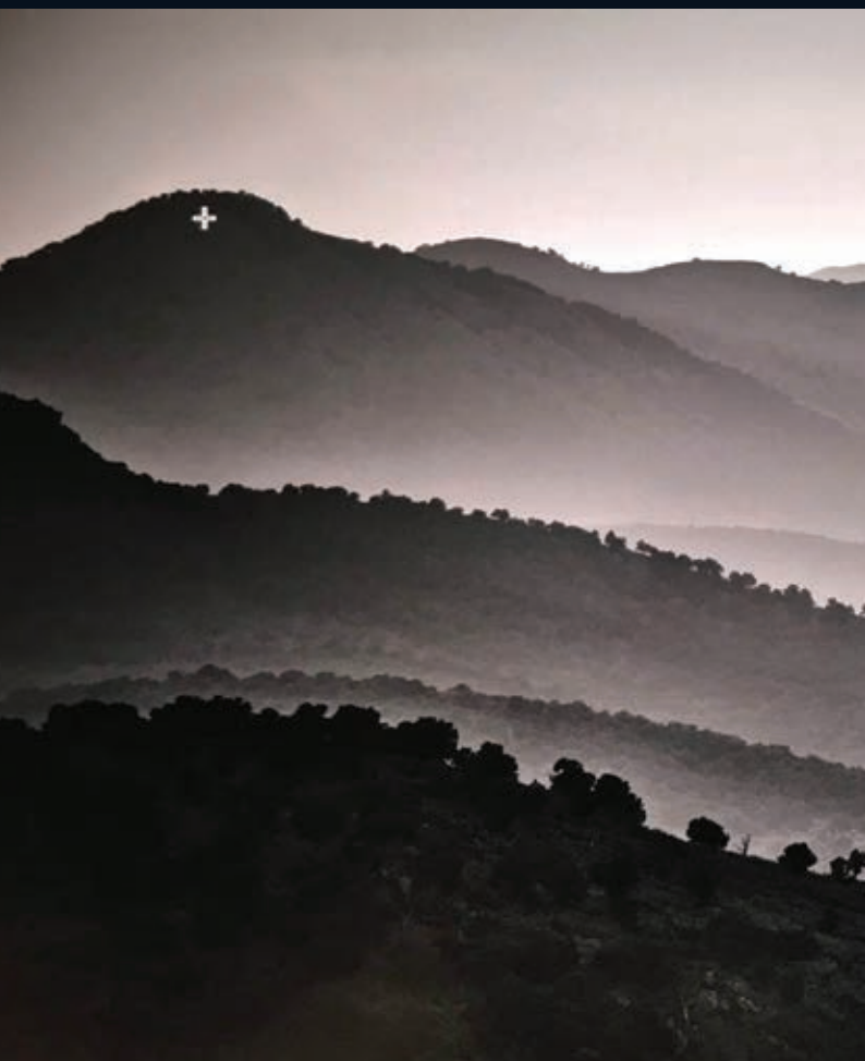
Les montagnes de Stamna