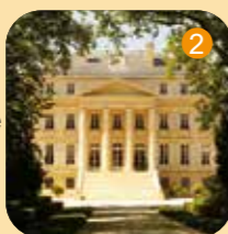
Château Margaux architecture néoclassique (XIX e siècle, monument historique)