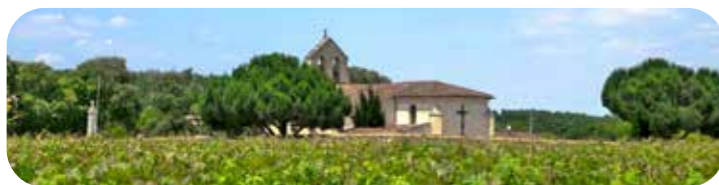
Eglise Saint Martin de Labarde

Visite sur RDV du lundi au vendredi de 9h à 16h. Tél : +33(0)5 57 88 35 91