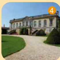
4 Château Plaisance à Macau, château viticole des XVIII e et XIX e siècles, chartreuse, monument historique