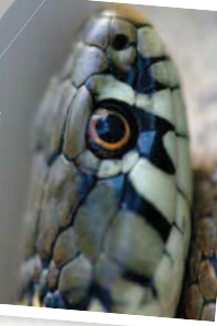
Couleuvre à collier

Les reptiles sont souvent qualifiés à tort d'animaux à sang froid. Ils sont simplement incapables de réguler seuls leur température corporelle, contrairement à l'Homme qui est quant à lui capable de thermorégulation. Les reptiles se servent donc de leur environnement pour réguler leur température corporelle.