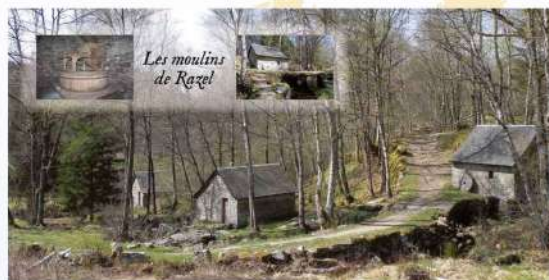
Les moulins de Razel

Ces derniers nichés au creux d'un dédale de pierres et d'eau, sont les témoins d'un temps révolu. Face au soleil, avec eux remontez le temps, quand les hommes vivaient en harmonie avec leur environnement immédiat. Les "ponts planches" ou "ponts de pierres" guident vos pas.