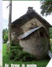
Le four à pain