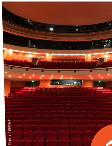
BAYONNE > THÉÂTRE