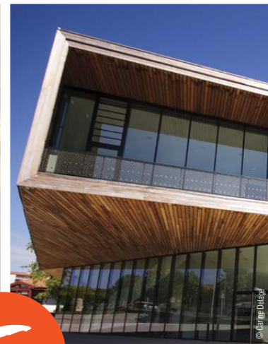
ANGLET > THÉÂTRE QUINTAOU