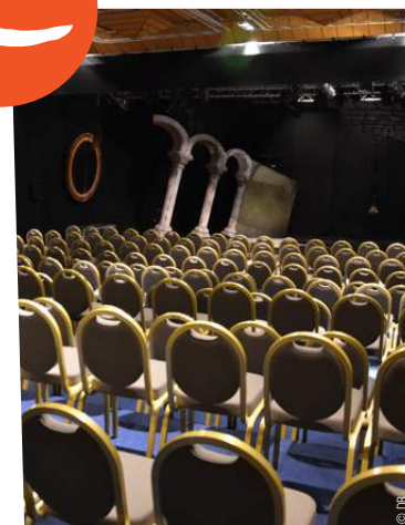
BOUCAU > APOLLO