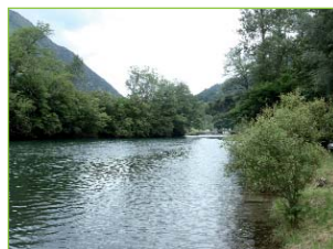
Vue sur la partie aval

Les berges sont moins abruptes, le courant plus faible. Il s'agit du meilleur endroit pour prospecter au "bouchon". Ce secteur est assez profond et possède de nombreuses racines d'arbres immergées. Il doit être exploité avec minutie et discrétion. L'absence de vaguelettes formées par le courant rend l'approche difficile car les poissons auront une meilleure visibilité. Les plus grosses truites ne se tiennent d'ailleurs pas au milieu mais en bordure, cachées sous la berge.