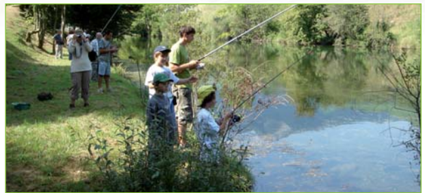
Animations en faveur des jeunes sur la retenue de Bedous

Cette partie médiane offre le meilleur profil pour que les poissons s'y "tiennent" (courant moyen, caches en bordure...). A ce niveau, une plateforme dédiée (stationnement+ponton) aux personnes à mobilité réduite a été aménagée. Il est préférable de ne pas rentrer dans l'eau, toujours pour une question de discrétion.