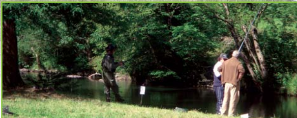
Partie de pêche sur la retenue de Bedous

D'une longueur d'environ 250m, la retenue présente un profil homogène : le gave s'étale ici sur une vingtaine de mètres pour une profondeur moyenne d'environ 1,50m.