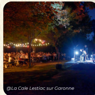
@La Cale Lestiac sur Garonne