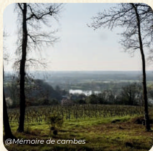
@Mémoire de cambes

Site Internet : www.sauvegarde-de-rions.com