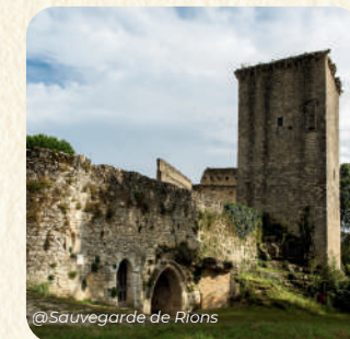
@Sauvegarde de Rions