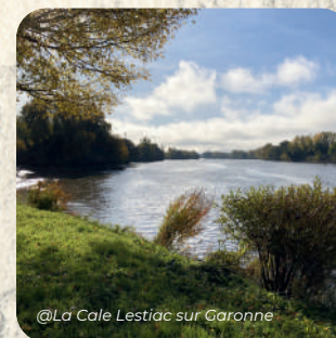
@La Cale Lestiac sur Garonne