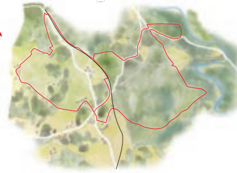
de la Communauté de Communes