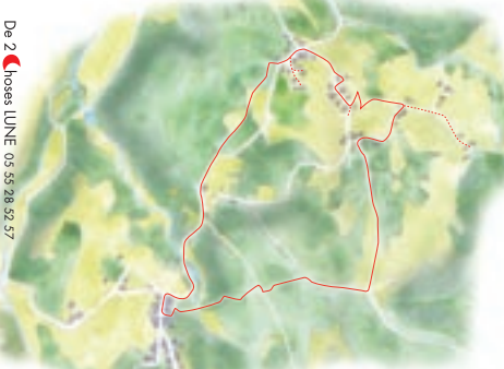
Voir la carte "Balades en Haute-Corrèze" offerte dans les Offices de Tourisme ou mairies de la Communauté de Communes.