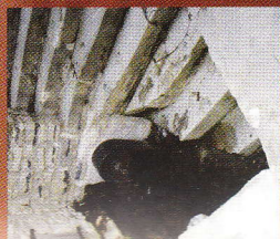
2 Fontaine du Talé