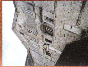
5 Maison Barthe