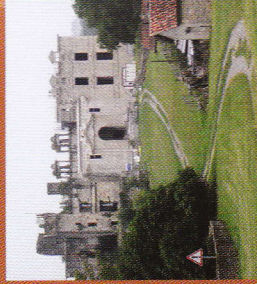
10 Château Ducal de Gramont