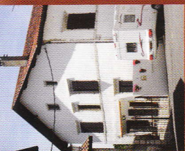
6 Maison Apremont