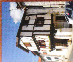
3 Maison Haramboure