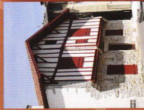
9 Maison Tanneur