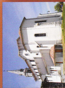
8 Église St-Jacques le Majeur