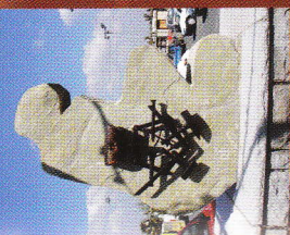
1 Stèle des tailleurs de pierre