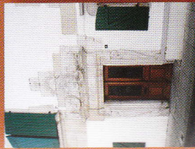
4 Maison Missabe