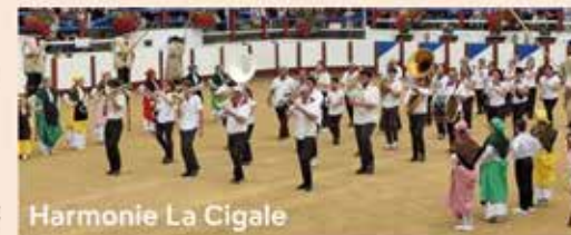
Harmonie La Cigale

Depuis des générations, l'Harmonie La Cigale de Morcenx fait vibrer les fêtes et animations bien au-delà du Pays Morcenais. Son répertoire éclectique voyage de la musique de films aux grands classiques, en passant par le jazz, les bandas et les musiques populaires. Portée par l'énergie et la passion de ses musiciens, La Cigale partage partout un véritable esprit de fête, de convivialité et de tradition landaise.