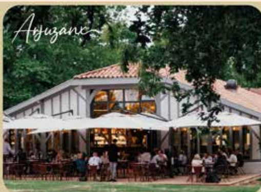
table landaise CATACHÔT 05 58 07 65 58 catachot.fr