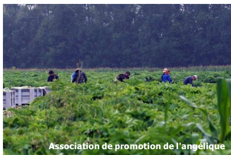
Association de promotion de l'angélique

L'angélique est cultivée sur notre territoire à Coulon, Magné, Saint-Liguaire et Bessines.