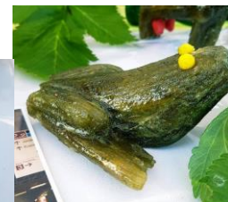
Association de promotion de l'angélique