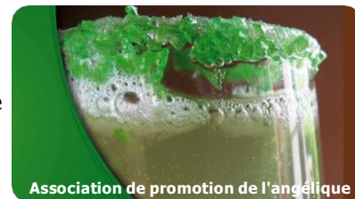
Association de promotion de l'angélique