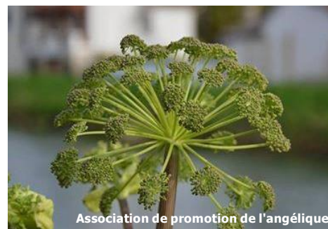
Association de promotion de l'angélique