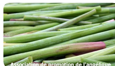
Association de promotion de l'angélique

La semence se fait début juin avec des graines séchées et l'angélique est repiquée en octobre. Lorsque l'angélique atteint environ 1,5m, les jeunes tiges peuvent être récoltées et cuisinées pour en faire des confiseries ou de la liqueur.