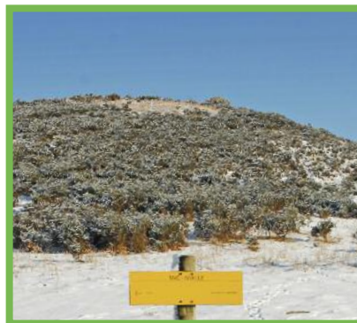
Balisage au pied de la redoute d'Olhain