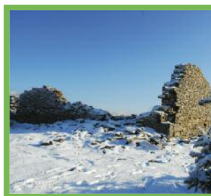
Ancienne Chapelle d'Olhain

Olhain est séparée de la Rhune par un col qui était un lieu de passage pastoral. Il ne reste plus que des ruines de la chapelle, vestiges d'un édifice relativement important qui devait mesurer 20 m x 8.80 m. Ce lieu, pourrait avoir été, selon les anciens de Sare, le refuge d'un ermite entre 1793 et 1813. Les habitants de la région, très attachés à leurs traditions, continuèrent, pendant de longues années à se rendre en procession sur cet emplacement, en particulier la veille de l'ascension. La Chapelle d'Olhain est entourée par les ruines d'une redoute de forme pentagonale dont deux côtés font plus de 25 mètres. (extrait du livre Autrefois Sare par J.Antz, éd. Atlantica 2005)