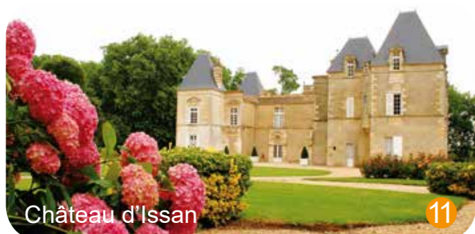
Château d'Issan 11