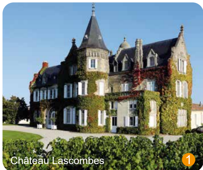
Château Lascombes 1