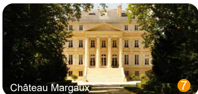
Château Margaux 7