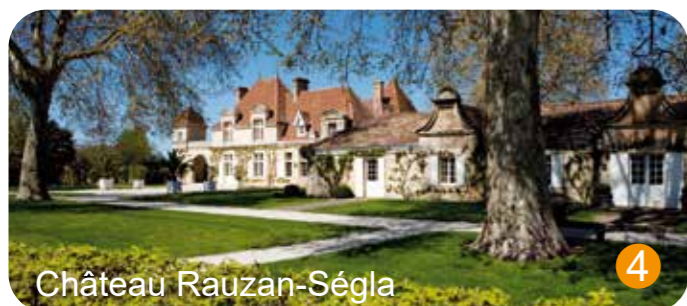
Château Rauzan-Ségla 4