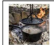
De l'eau bouillante