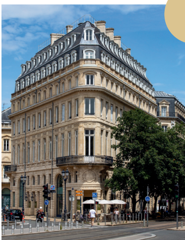
Maison Gobineau - CIVB

Réponse 3 : Les trois monuments représentés sur le plan en bronze sont : le Grand-Théâtre, l'église Notre-Dame et le palais de la Bourse.