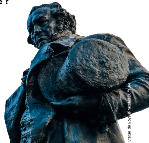
Statue de Goya

Sur la place du Chapelet se trouve la statue d'un peintre espagnol qui vit les dernières années de sa vie à Bordeaux. Il est élégamment habillé, mais que tient-il dans sa main droite ?