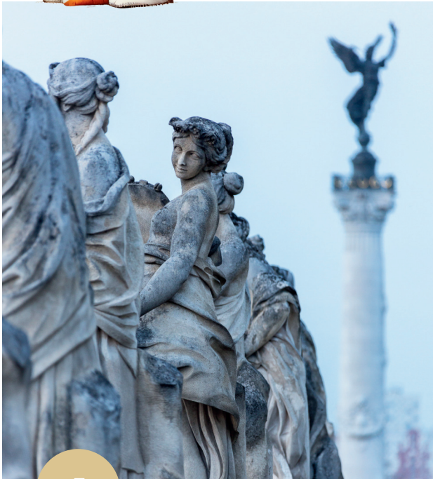
Muses et déesses du Grand Théâtre - Détail architecture

Tu arrives sur la place de la Comédie où se trouve le Grand Théâtre de Bordeaux. Observe les statues au-dessus des colonnes. De quel instrument joue Euterpe, la muse de la musique située la plus à gauche ?