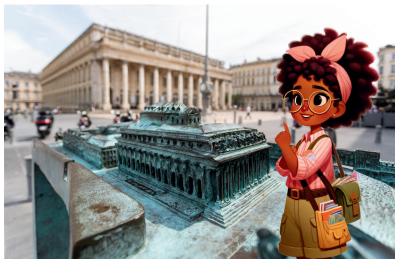
Le Grand Théâtre - Plan-relief