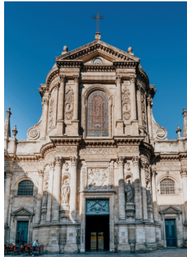
Eglise Notre-Dame

Prends la rue Mautrec jusqu'à l'église Notre-Dame, superbe église baroque du 18 e siècle. Au-dessus de la porte d'entrée, se trouve un bas-relief qui représente l'apparition de la Vierge Marie à Saint-Dominique. Il y a un animal représenté dans cette scène, lequel ?