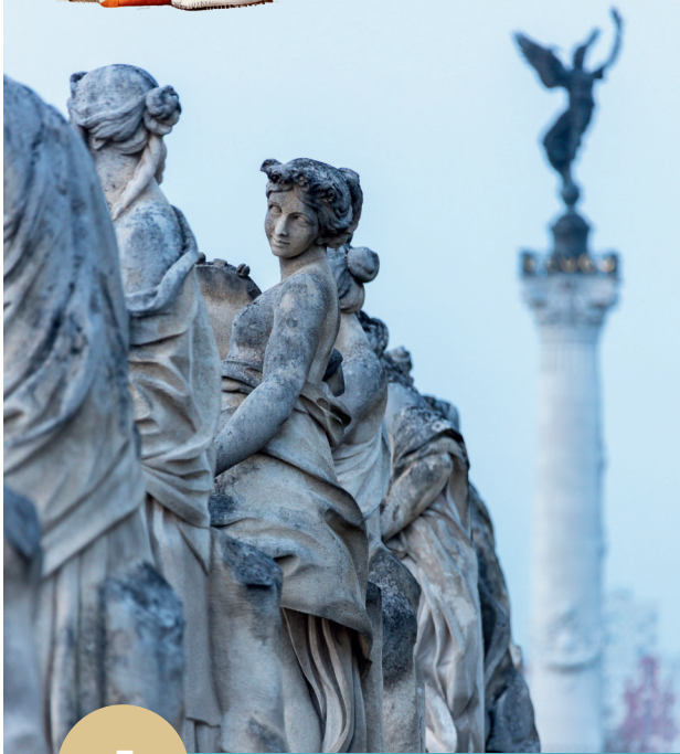
Las musas y diosas del Gran Teatro

Has llegado a la plaza de la Comédie, donde se encuentra el Gran Teatro de Burdeos. Fíjate en las estatuas que hay sobre las columnas. ¿Qué instrumento toca Euterpe, la musa musical situada en el extremo izquierdo?