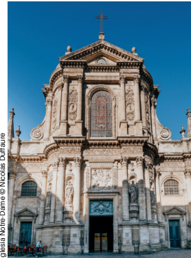
Iglesia Notre-Dame

Toma la calle Mautrec hasta la iglesia de Notre-Dame, una magnífica iglesia barroca del siglo XVIII. Encima de la puerta de entrada hay un bajorrelieve que representa la aparición de la Virgen María a Santo Domingo. ¿Qué animal aparece en esta escena?