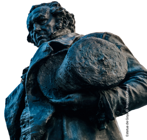
Estatua de Goya

En la plaza del Chapelet hay una estatua de un pintor español que vivió los últimos años de su vida en Burdeos. Va elegantemente vestido, pero ¿qué lleva en la mano derecha?