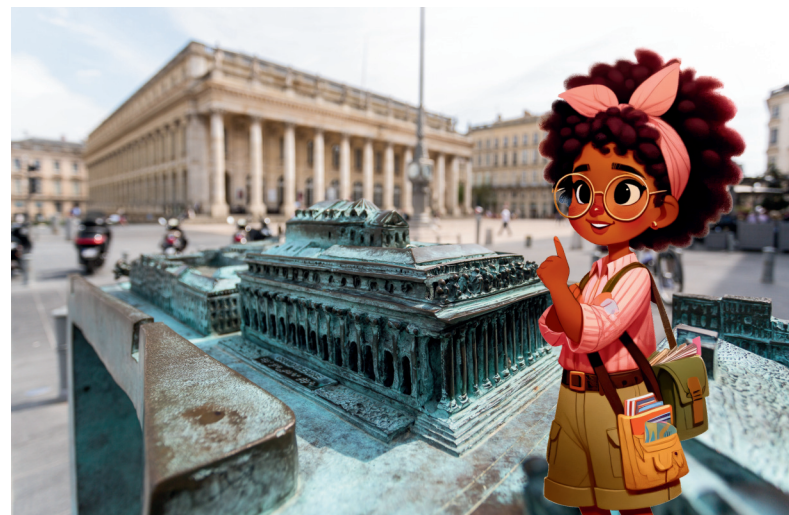
El Grand Théâtre - plano de relieve