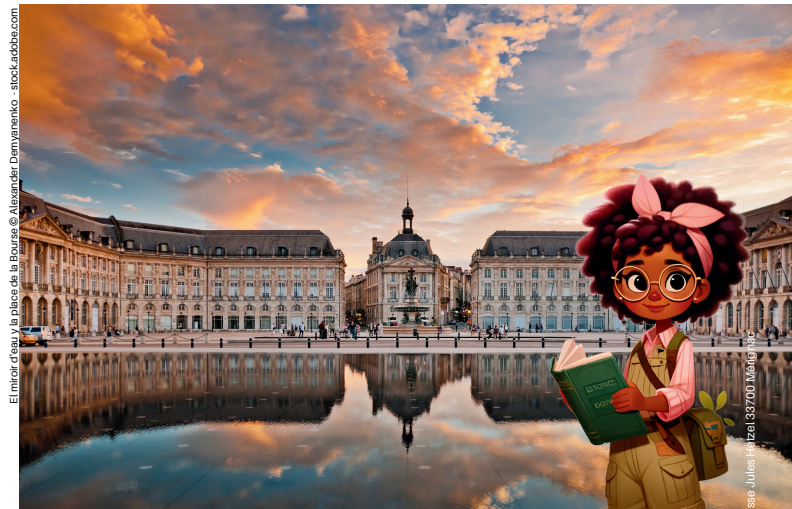
El interior de la plaza de la Bourse

Te invitamos a pasear por la calle Saint-Rémi en dirección a la plaza de la Bourse para descubrir el antiguo barrio de Saint-Pierre y el espejo de agua frente al Garona.