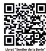
Livret "Sentier de la Berle"

Attention, le sentier est uniquement piéton, et n'est pas praticable pour les vélos.