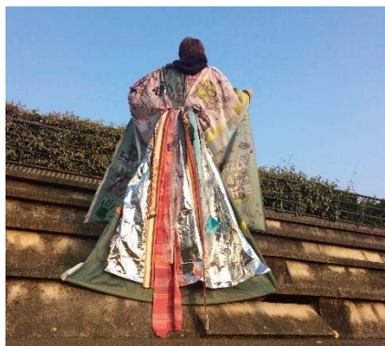
Septembre 2016 – mai 2017 : créations de Cantau.