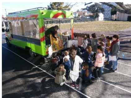
13-17 février 2017 : première venue du collectif art nOmad.