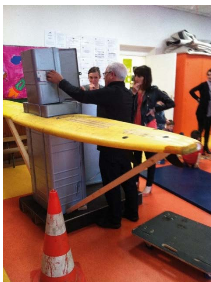
Mai-juin 2017 : aide technique des services municipaux.