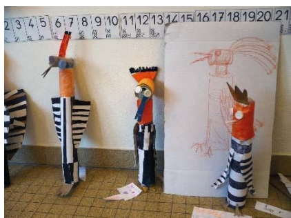
Mai-juin 2017 : production des œuvres.