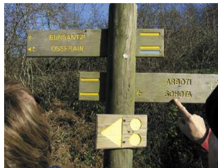
Una fotografía local de los senderos o de la señalización

Los itinerarios que les proponemos han sido preparados con la mayor atención. Sus impresiones y observaciones en cuanto al aspecto de nuestros senderos nos interesan y nos permiten mantenerlos en buen estado. Les invitamos a comunicarnos sus observaciones poniéndose en contacto con la oficina de turismo de Baja Navarra, en Saint-Palais, llamando al +33 5 59 657 178. Allí podrán pedir una ficha de observación “Ecoveille”.