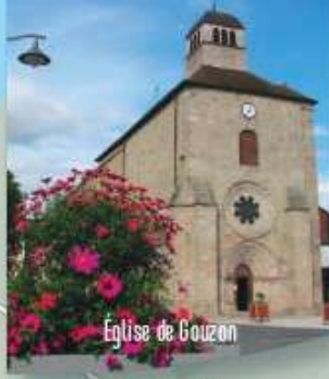
Eglise de Gouzon