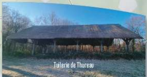
Tuilerie de Thureau