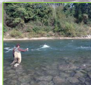
Plat courant sur le secteur intermédiaire

Plus haut , c'est un énorme plat courant qui prend naissance au niveau du gros rocher. Les deux berges sont alors les zones à prospecter en priorité. Toutefois et notamment l'été, c'est dans la veine centrale qu'il faudra aller chercher le poisson. Les abords et l'aval immédiat du gros bloc sont souvent le secteur sauve-bredouille.