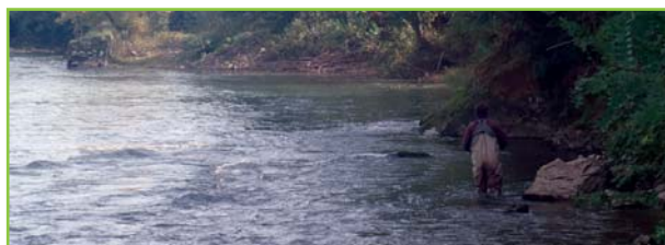
bordure rive gauche sur le secteur amont

En continuant la progression vers l'amont , c'est la bordure rive gauche qui devient extrêmement intéressante. Elle présente tous les faciès recherchés par la truite en terme d'habitat et de zone de nourrissage. Les niveaux d'eau permettent généralement de remonter la bordure jusqu'à la réserve en aval du barrage. Il faut alors peigner méticuleusement tous les cailloux qui peuvent abriter un poisson. Faites attention toutefois car le gave de Pau est une rivière extrêmement puissante. Ne dépassez pas vos limites !