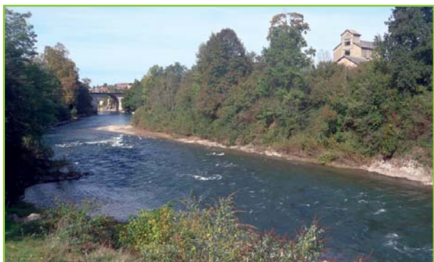
Vue sur la partie aval

L'AAPPMA la Gaule Orthézienne réalise des empoissonnements réguliers en truites arc-en-ciel de qualité afin de préserver une qualité de pêche tout au long de la saison.