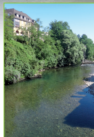
Vue sur le plateau à l'aval immédiat du pont Jaca

de Jaca. Un magnifique lisse se forme pour les moucheurs les plus aguerris: n'hésitez pas à explorer les moindres recoins de la berge opposée.