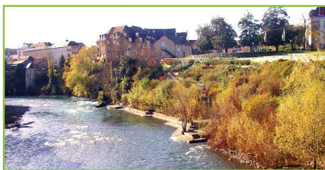
Vue sur le quai submersible (rive gauche) et le coude en amont

jusqu'à l'amont immédiat de la passerelle piétonne qu'il convient de prospecter à la mouche sèche lors d'éclousions massives de baetis au printemps ou de sedge l'été.