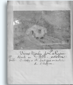
Vieux Moulin de La Roque, dessin d'un malade de l'Hospice.