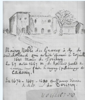
La maison noble du Gravey, dessin de R. Durat.