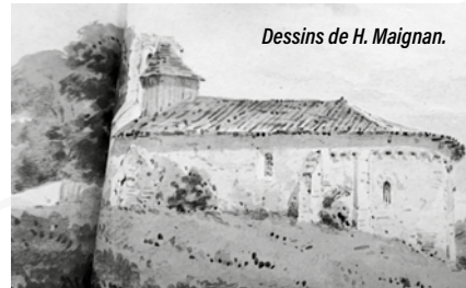
Dessins de H. Maignan.

Henri Maignan (Bordeaux, 1815-Rions, 1900) est un contemporain de Leo Drouyn. Ce propriétaire bien installé à Rions – il habite sur les coteaux du domaine de Thibaut d'où la vue est superbe sur la vallée de la Garonne – a une double passion ; la marine, les bateaux... et les beaux-arts qu'il pratique assidûment. Comme ses contemporains, il est passionné de patrimoine et ses dessins offrent également un remarquable intérêt documentaire. Il dessine et peint tout au long de sa vie, pour sa famille et ses amis. Artiste prolifique, il dessine dans des albums de terrain ou peint in situ ; il a laissé des centaines de dessins, au crayon ou aquarellés, dont ceux concernant la vallée de la Garonne ont été publiés en 2017 par l'association de Sauvegarde de Rions et les Éditions de l'Entre-deux-Mers. À Laroque, il a laissé deux dessins de l'église du XII e siècle dédiée à Saint Jean Baptiste.