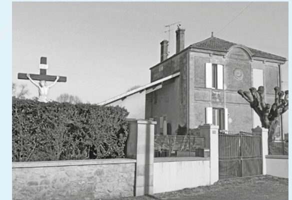
L'ancienne école communale.