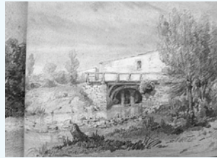
Pont moulin de Rolland construit en 1746, dessin de H. Maignan.

Le moulin à eau de Rolland, sur l'Euille est situé au pied de l'ancien château de Laroque et bénéficie de la célèbre chute de 4 mètres de haut située à cet endroit. De 1917 à 1924 une scierie a utilisé cette énergie hydraulique et a fabriqué notamment des manches à balai pour l'armée américaine.