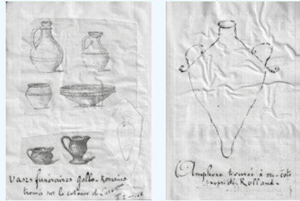
Vestiges archéologiques trouvés à Laroque, dessins de R. Durat.

Raymond Durat, natif de Quinsac, propriétaire terrien, fut maire de Laroque en 1869-1870. Il a beaucoup écrit et dessiné sur son village. Voici quelques-uns de ses dessins : la maison noble de Gravey et de nombreux vestiges archéologiques. Sur l'emplacement de l'ancien château féodal, il avait fait construire une « villa moderne » les seuls restes visibles sont les balustres et le moulin.