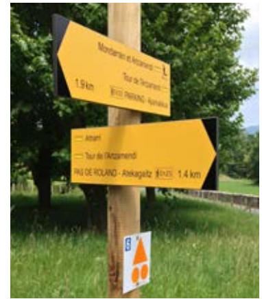
Señalización de las rutas

GR®, GRP® y PR® son marcas registradas por la Federación Francesa de Senderismo. Algunos de estos itinerarios han sido seleccionados por la Federación Francesa de Senderismo en atención a criterios de calidad, se distinguen por el sello PR®.