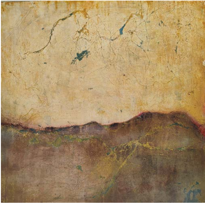
Les atmosphériques, 4 - technique mixte sur toile de lin

A partir de matériaux naturels ou recyclés, je conçois des peintures où le figuratif dialogue avec l'abstraction. Je travaille, selon la texture recherchée, sur des supports variés (toiles de lin et de coton, papiers en bouse d'éléphant, panneaux de bois et médium, ardoises récupérées dans de vieilles maisons...). J'utilise des peintures (huiles, acryliques et encres) que je fragmente, abruse, dilue et applique en multicouches pour créer des effets de profondeur et de relief. Dans certains cas, selon l'effet désiré, le sable, la terre, le crin, le chanvre et plus largement, toute matière fournie par la nature peuvent s'inviter dans le tableau.