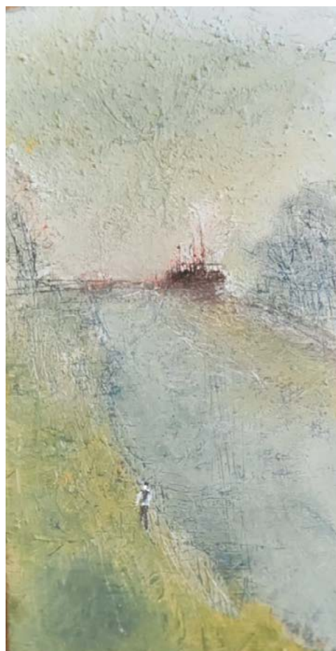
Morceau d'horizon°11 - huile et encre sur bois