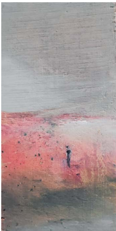
Morceau d'horizon°5 - huile et encre sur bois

J'expose en France et à l'étranger, dans plusieurs galeries, boutiques, salons, châteaux sans être lié à une galerie particulière. J'ai obtenu le certificat du mérite artistique du Grand Duché du Luxembourg.