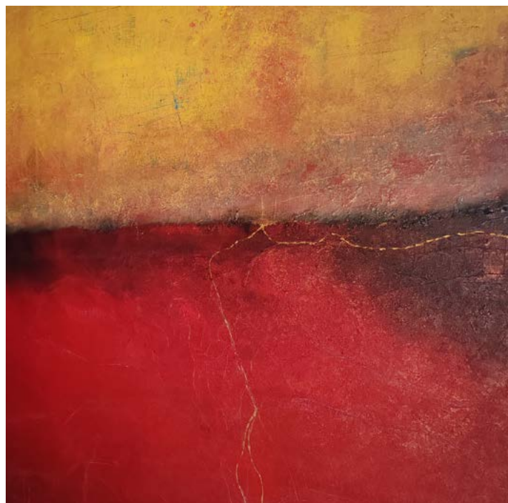
Les atmosphériques, 16 - technique mixte sur toile de lin

l'artiste présente un travail pictural centré sur la couleur, la matière et la profondeur.