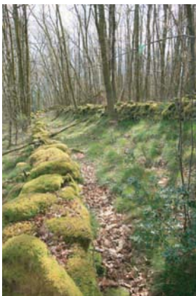
Photo du circuit

12 Rejoindre une route à prendre à gauche, puis s'engager dans un chemin à droite. Après la traversée d'un ruisseau, au débouché sur la D 3, tourner à gauche, puis entrer à droite et traverser le village de Dournand pour atteindre le lavoir et la fontaine restaurés.