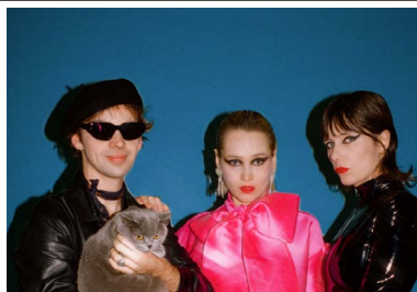
Figure incontournable de la scène électronique underground depuis les années punk, DJ Marcelle van Hoof est une Néerlandaise qui joue sur trois platines simultanément, construisant des sets impossibles à classer : entre techno, dub, post-punk, musiques africaines, acid et bien d'autres choses encore. Surnommée « le John Peel féminin » pour son émission de radio culte Another Nice Mess. Ses performances sont inventives, euphoriques, et radicalement libres, une artiste qui refuse de se laisser enfermer dans un genre.