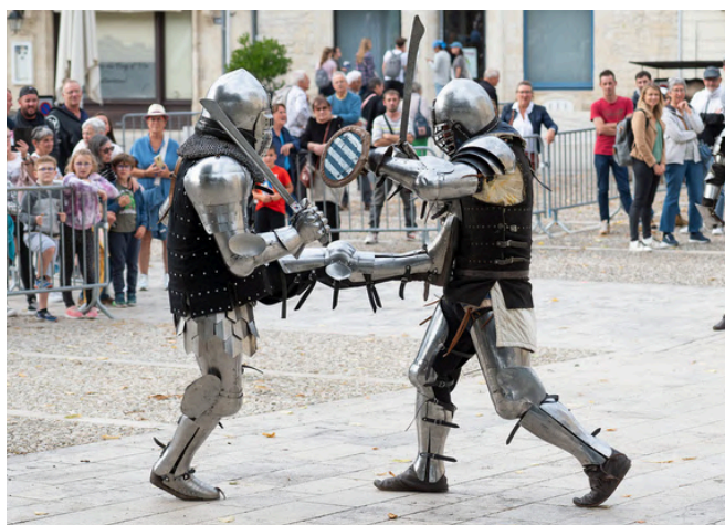
Au Grès des Armes

Lors de cette journée d'exception, vous pourrez ainsi croiser à la fois un chevalier en armure du XVe siècle, un mousquetaire ou encore un capitaine d'un navire du XVIIe siècle, tout en vous retrouvant au beau milieu d'un bal à l'époque de Napoléon. Plus d'une vingtaine de personnes seront en costume d'époque à cette occasion.