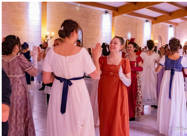
Bal d'Antan, un pas dans l'histoire