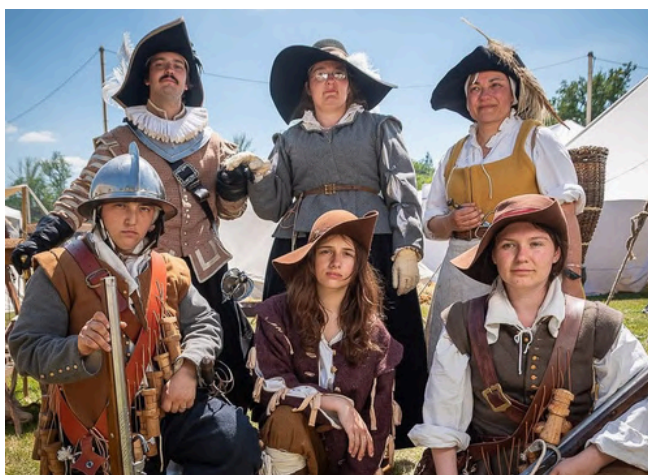
Les Héritiers du Geste