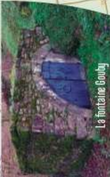
La fontaine Gouby