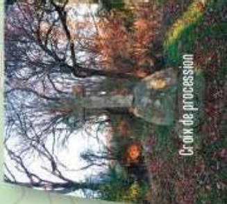
Croix de procession