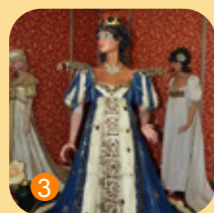
Palais du Costume Lesparre-Médoc