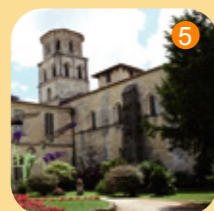
Abbaye et abbatale de Vertheuil

Découvrez le patrimoine de Lesparre-Médoc avec un jeu de piste