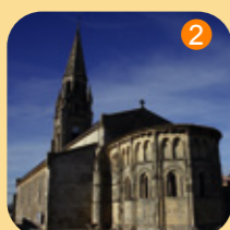
Eglise Notre Dame Lesparre-Médoc