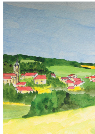
Montignac de Lauzun

Sur ce circuit, découvrez comment les constructions révèlent le paysage environnant.