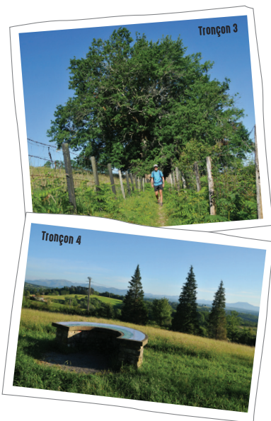
Table de pique-nique : colline d'Elorrimendi, 4,4 km. UTM : 627633 - 4812076