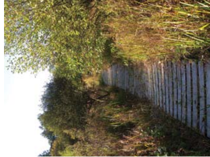
Sentier d'interprétation de Mayéras

9 Accéder au pont en empruntant les marches (ne le traversez pas). Au bout du pont tourner à droite, longer les jardins médiévaux et rejoindre le point de départ, en longeant la Vienne.