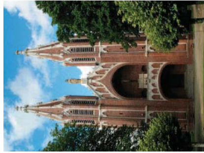
La chapelle d'Arliquet