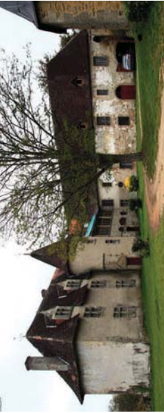
Château de l'Osmonerie

6 Au carrefour des 4 routes, tourner à gauche puis après les maisons entre deux clôtures de nouveau à gauche. Poursuivre jusqu'à Puy Némard, emprunter la voie communale à gauche puis un chemin qui descend vers le lieu-dit Chez Derre.