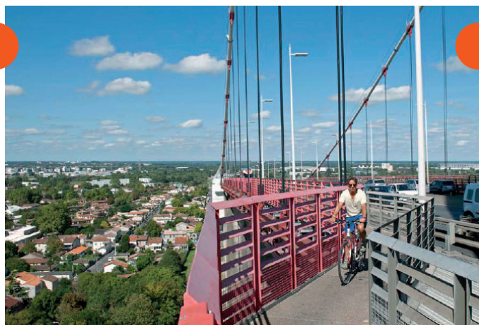
Piste cyclable pont d'Aquitaine

Cette balade urbaine, située de part et d'autre de la Garonne, vous invite à découvrir les nombreuses facettes de la métropole bordelaise. Paysages fluviaux, ensembles architecturaux classiques (façades XVIII e siècle), ambiances artistiques et contemporaines (nouveaux quartiers, street art, Refuge périurbain) viennent ponctuer cette balade accessible à tous. Grâce aux 4 ponts qui traversent la Garonne, vous pourrez ajuster la longueur de votre circuit en fonction de vos envies.