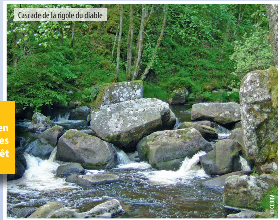
Cascade de la rigole du diable

D'énormes chaos granitiques, arrondis par l'érosion, sont disposés un peu partout sur le site : sur les berges, dans la rivière et sur les pentes acérées. Ils confèrent au site son ambiance si particulière et témoignent de l'évolution géologique du lieu.