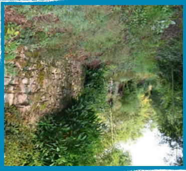
▶ 4 Le Chemin de la Grand Planche