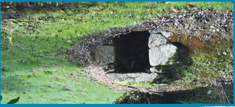
▶ 3 La Fontaine du Moulin de La Grand Planche