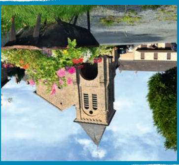
▶ 2 L'Église Saint Léon

Cette église romane, dédiée à Saint Léon, fut reconstruite en 1942 sur l'emplacement des ruines de l'ancienne église qui quant à elle aurait été construite au XII e siècle.