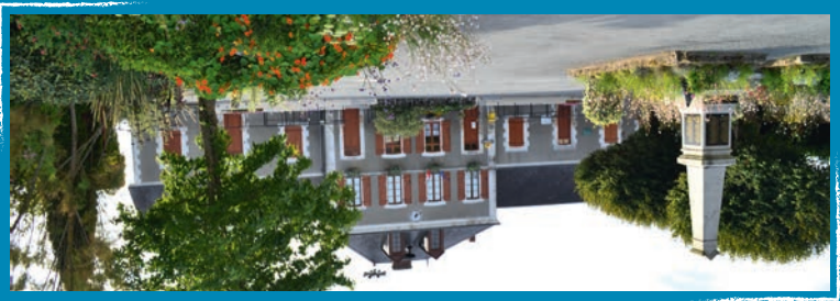
▶ 1 La Place de la Mairie et de son Monument aux Morts

Création / Impression www.lzatis.com