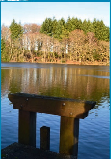
▶ 10 Point de vue remarquable sur les Monts de la Marche

Magnifique étang de plus de 4 hectares où l'on peut observer une grande variété d'oiseaux.