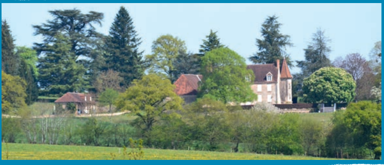
▶ 9 L'Étang du Moulin (propriété privée)

Cette ancienne demeure fortifiée est aujourd'hui une habitation privée. Son cèdre du Liban est sûrement l'un des arbres les plus remarquables de la commune.