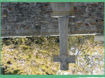
► 1b La Croix et la Table des Morts

Installé à l'entrée du village, à proximité d'une source, cet abreuvoir servait à faire boire les animaux, notamment les bovins. En hiver autrefois, en absence d'eau sous pression dans les bâtiments, les vaches étaient matin et soir dé-tachées et conduites à l'abreuvoir.