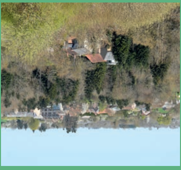
► 4 Point de vue remarquable Vue sur le bourg de La Cellette depuis le village du Boueix.

Installé à l'entrée du village, à proximité d'une source, cet abreuvoir servait à faire boire les animaux, notamment les bovins. En hiver autrefois, en absence d'eau sous pression dans les bâtiments, les vaches étaient matin et soir dé-tachées et conduites à l'abreuvoir.