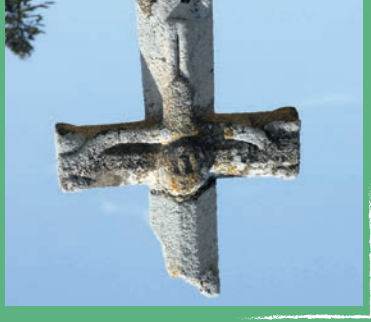
► 3 La Croix du Cimetière Cette croix en granite, située à l'entrée du cimetière, à droite de l'allée principale, date du XV e siècle. Elle est ornée d'un Christ primitif et repose sur un socle octogonal.