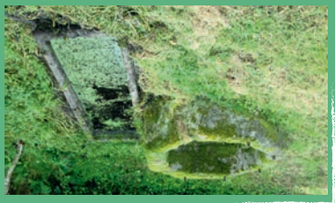
► 2 L'Abreuvoir du Bourg

Appelée aussi table d'attente des Morts, elle a été édifiée pour y déposer le cercueil et permettre aux porteurs de se reposer avant d'entrer dans le lieu de culte. Cette table monolithique en granite est installée devant une croix en granite chanfreinée posée sur un socle et un piédestal.