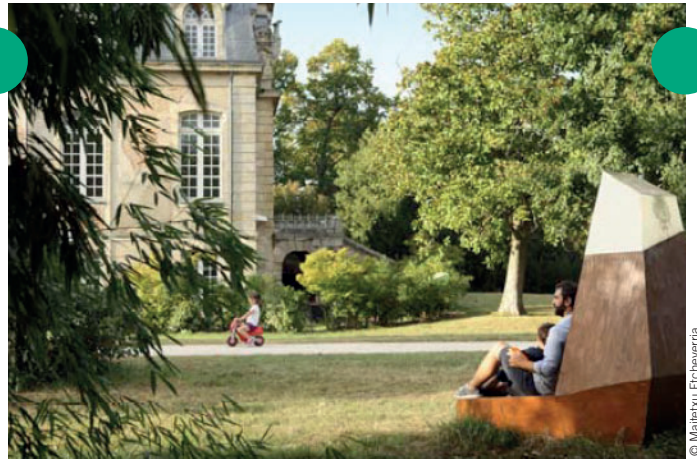
Domaine de Beauval - Bassens