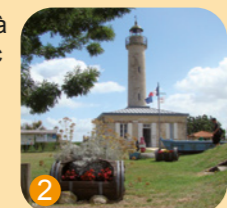
Phare de Richard à Jau-Dignac-et-Loirac

Un topoguide à votre disposition pour découvrir Jau-Dignac-et-Loirac à pied. Disponible gratuitement auprès de l'Office de Tourisme.