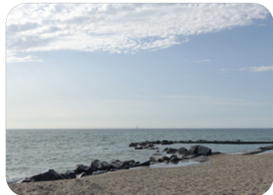
Plage océane de Saint-Nicolas