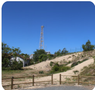
Le sémaphore militaire