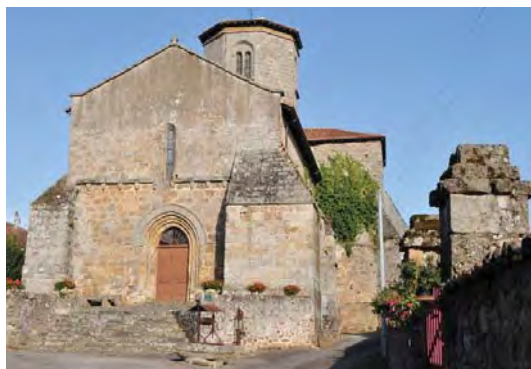
Eglise de Biennac