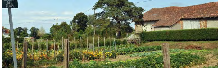
village des Plats

6 Laisser la rue principale qui tourne à gauche, prendre en face et suivre le chemin. Arrivé à la route, tourner à droite puis après la direction Gaud, prendre le chemin de crête à gauche et rejoindre les Plats.