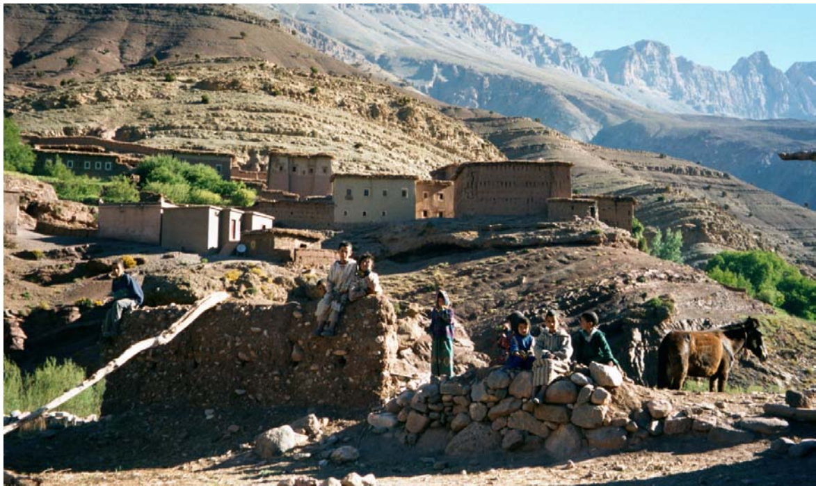
Aït Bouguemez un village de la vallée

Le financement du projet est assuré dans le cadre du 4 ème programme concerté MAE/Maroc et reçoit depuis 2004 une subvention de l'Union Européenne.