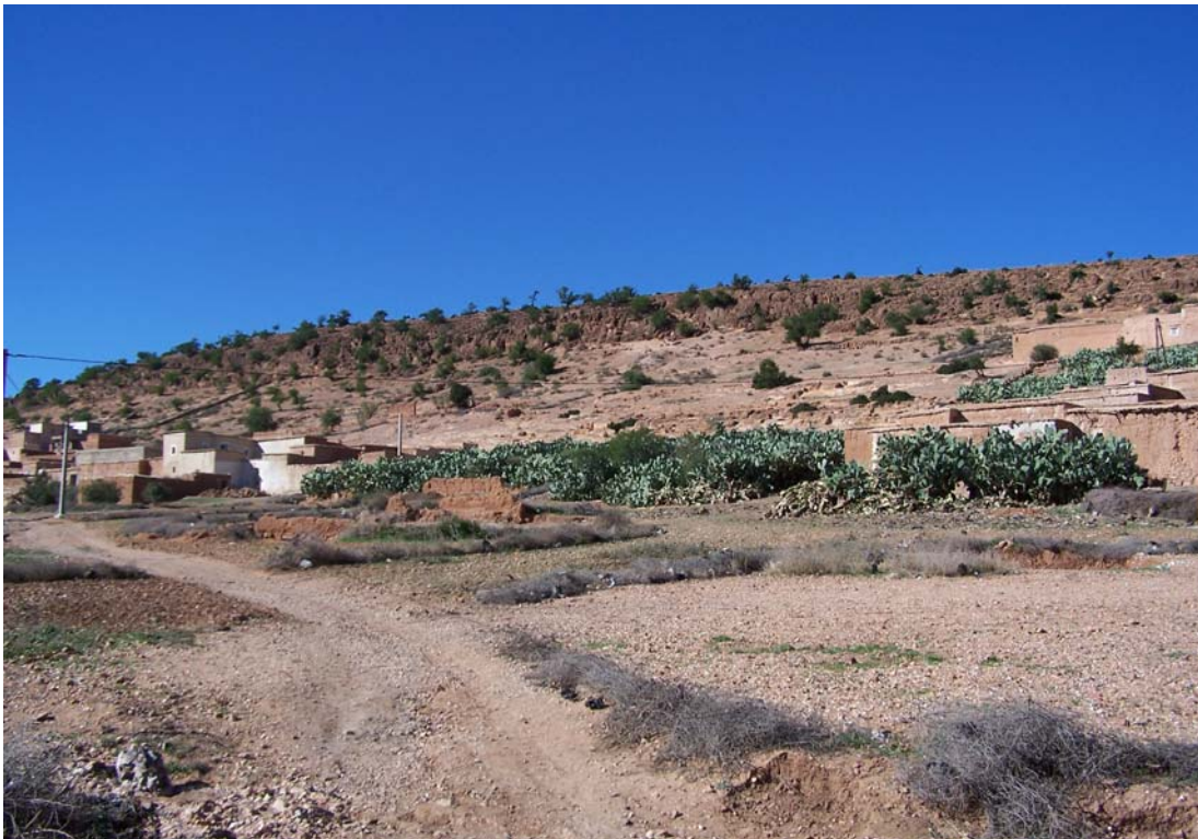
Paysage de la région et chantier de reboisement