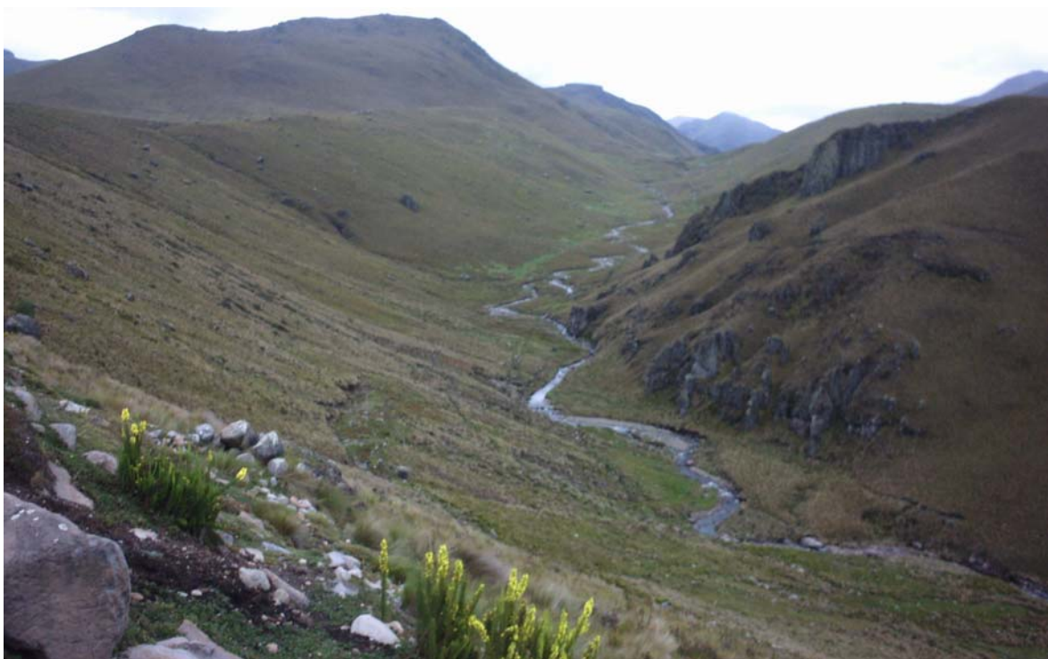
Paysage de la vallée de la région de Cañar (Foto tejidos y turismo 003 VSF/CICDA)

Dans cet exemple l'activité touristique est conçue comme complémentaire des actions de développement agricole.