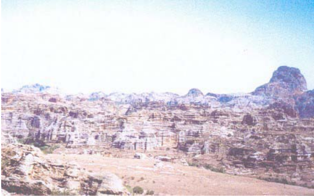
Paysage du Parc national de l'ISALO

A terme, un jumelage est programmé entre les Parcs de l'Isalo et du Vercors.