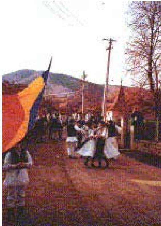
Equipements pour la fabrication du cidre et Groupe de danse traditionnelle à Sibiel