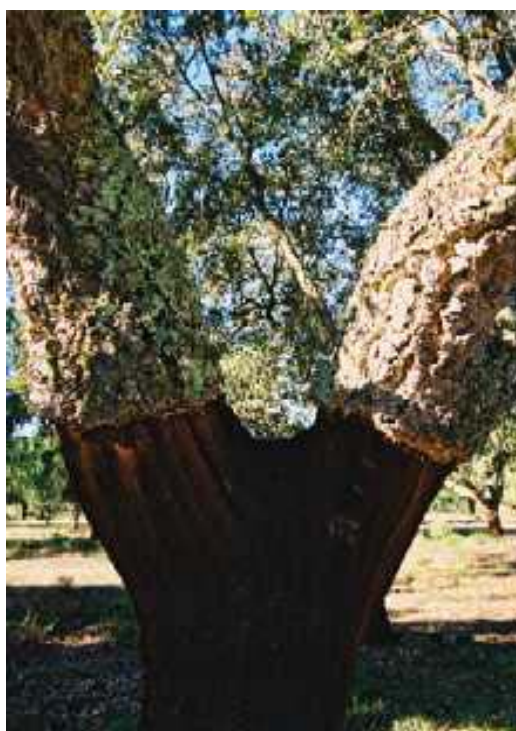
La production du liège une des richesses naturelles de la région

Le programme "EVORA 21" vise ainsi à mettre en cohérence l'ensemble des filières avec le territoire dans une recherche de qualité globale au bénéfice de l'ensemble des acteurs du territoire.