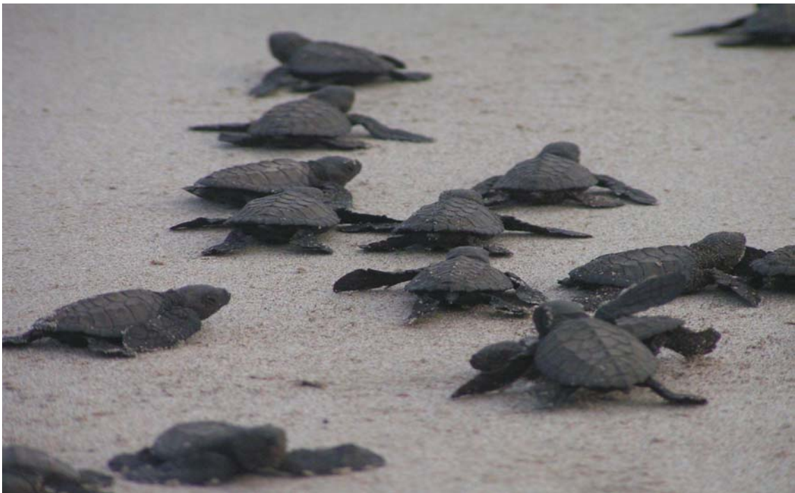
Une des richesses du site de Porto Alegre, les tortues marines