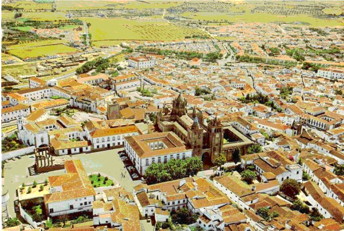
Vue du centre d'EVORA