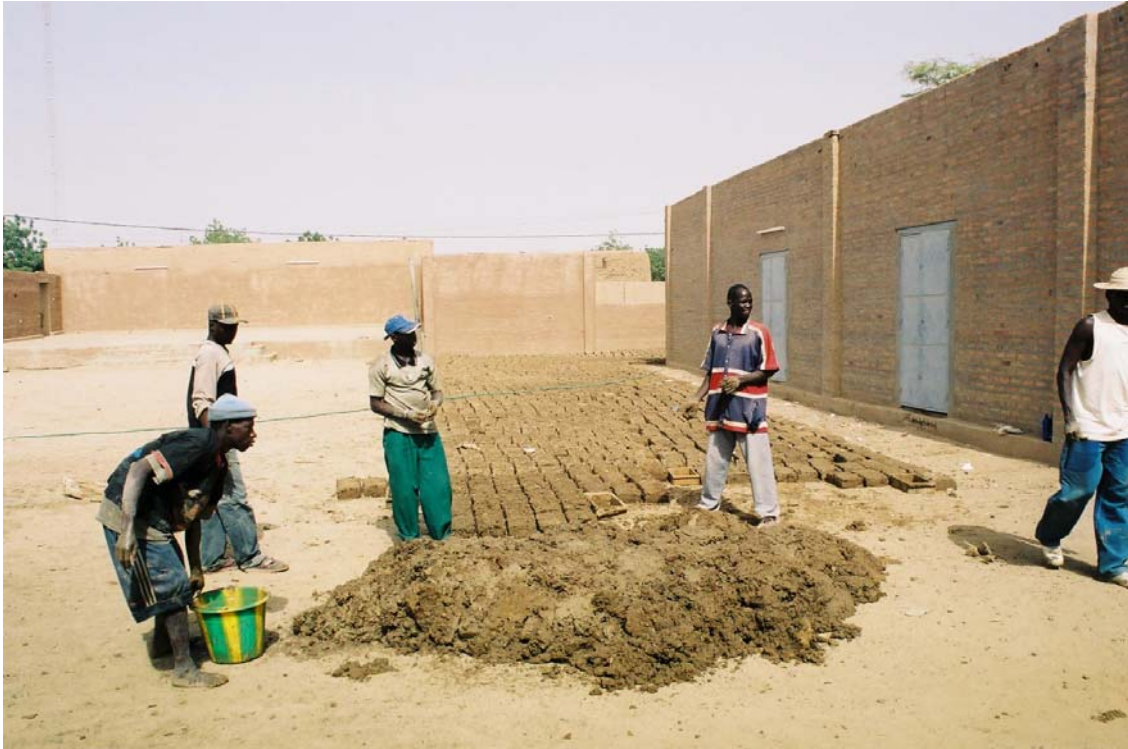
Fabrication de briques en banco pour un chantier de construction