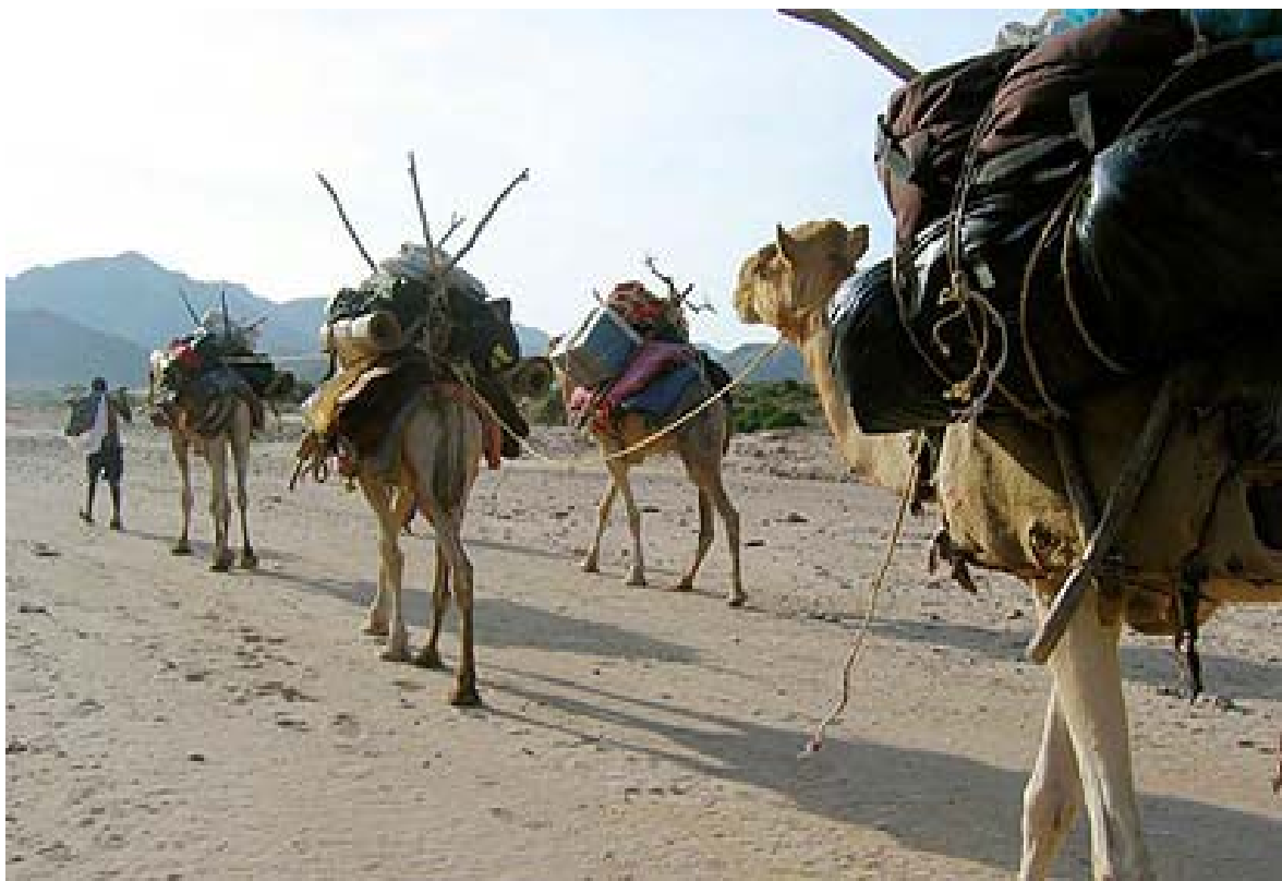
Caravane dans un oued le soir

Des circuits découvertes et thématiques sur l'ensemble de la république de Djibouti et une mise en relation avec des circuits caravaniers organisé dans l'Aoussa (Ethiopie) sont envisagés ultérieurement.