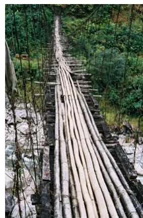
Sikkim, Réserve du Dzongu Communauté Lepcha