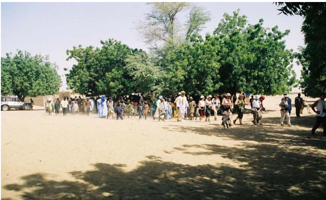
Un groupe de touristes dans un village du Cercle de Niafunke