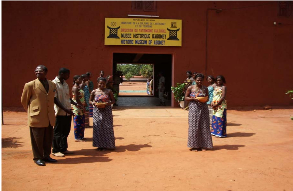
Palais royal d'Abomey, site inscrit au patrimoine mondial en 2004

D'autres actions de coopération décentralisée ont été initiées avec la ville d'Abomey pour l'amélioration des services (éclairage public, eau potable, communications) et le renforcement des capacités (formation des agents administratifs, état civil).