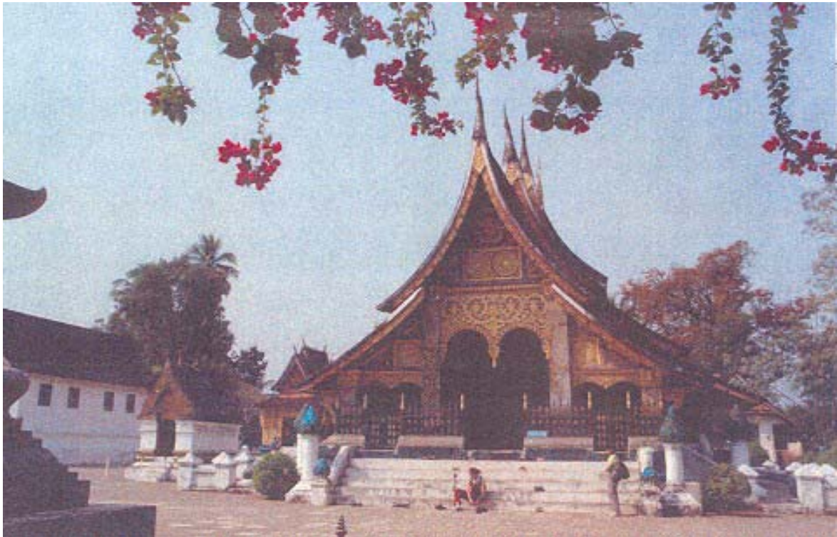
Un temple rénové à Luang Prabang

coordination des politiques menées en matière de développement économique et d'implantations commerciales dans une ville qui est devenue un site touristique majeur, cible d'investissements privés, mais exerçant une forte attractivité sur les populations périphériques et sujette à des pressions foncières difficiles à maîtriser. Parmi les actions retenues par le SCOT, la création d'un Parc naturel régional permettra de protéger les espaces naturels tout en permettant une valorisation de la région en matière d'animation, d'éducation, de développement économique et touristique.