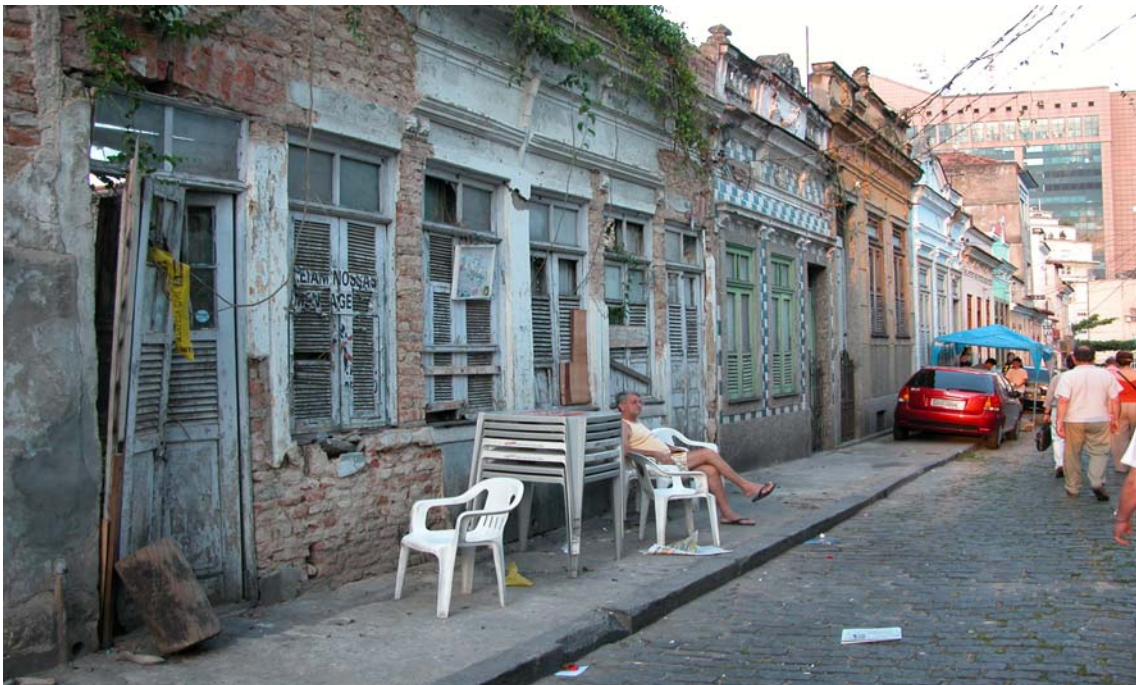
Rio de Janeiro : un quartier populaire en cours de réhabilitation Le Mauro da concepção. Situation avant travaux

Désormais intitulé « Procidade », cette opération, qui pourrait intéresser à terme une trentaine de villes. Elle porte actuellement sur 9 d'entre elles et s'articule avec les Plans de Réhabilitation des Centres Urbains, cofinancées par la France (études sur Fonds fiduciaires auprès de la BID) et la BID pour les réalisations.