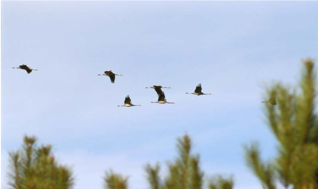
Vol de grues au dessus de pins