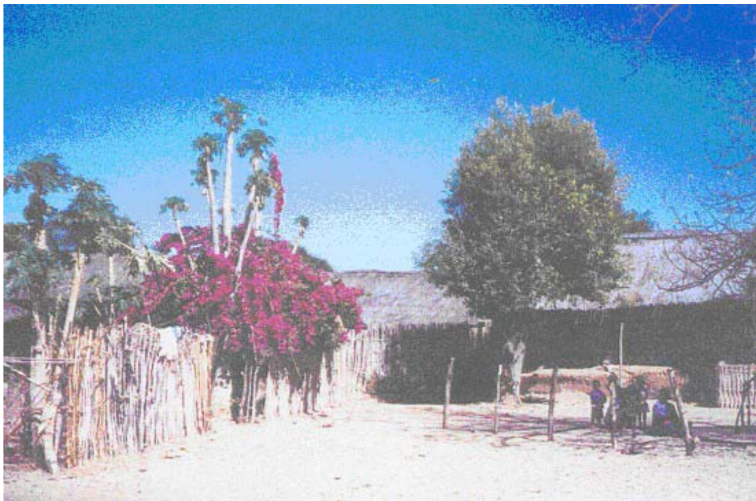
Un village de la périphérie du Parc appuyé par l'ANGAP et TETRAKTYS