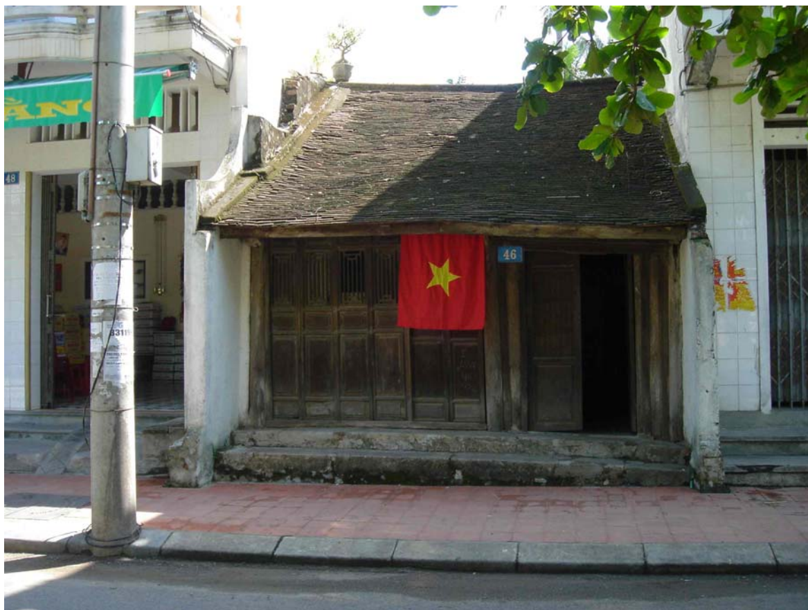
Restauration du patrimoine et valorisation touristique - une maison jardin dans les vieux quartiers de la ville de Hué