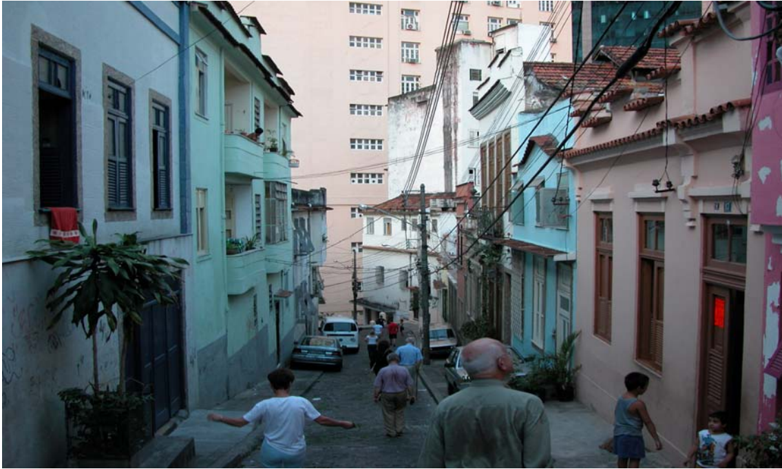
Le même quartier après travaux