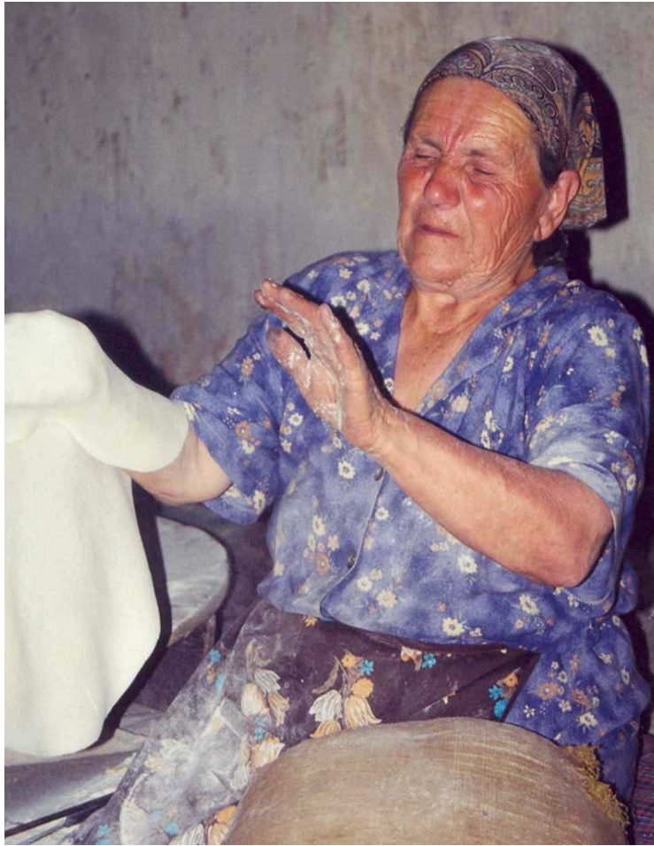
Fabrication du pain traditionnel arménien, le lavach

L'éco-tourisme s'appuie sur deux "chartes" adoptées au niveau international mais non spécifiques à ce type de tourisme :