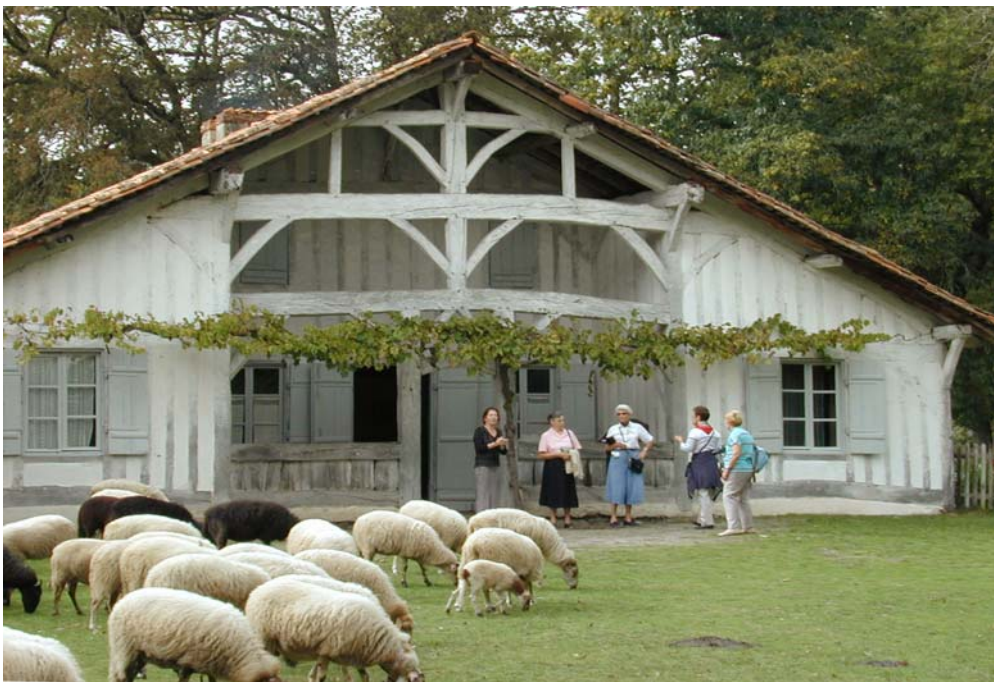
Eco-musée à Marquèze - PNR des Landes de Gascogne