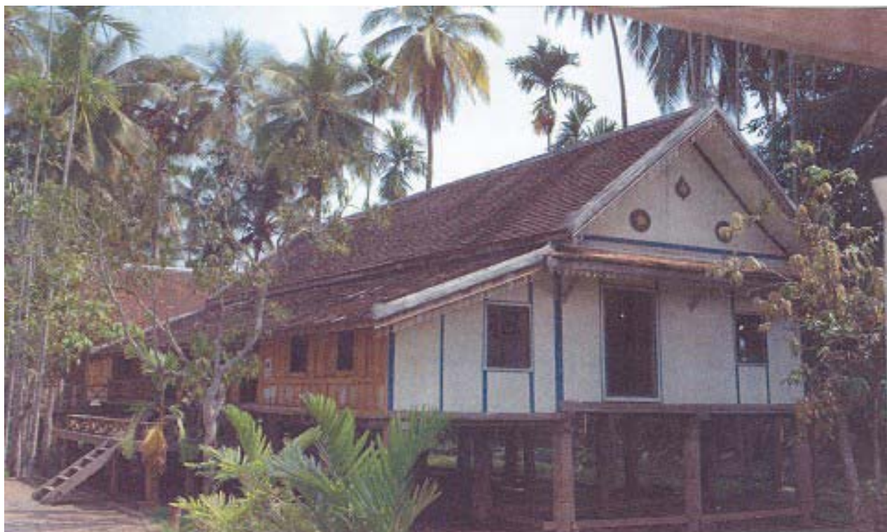
Un exemple de rénovation d'habitat traditionnel