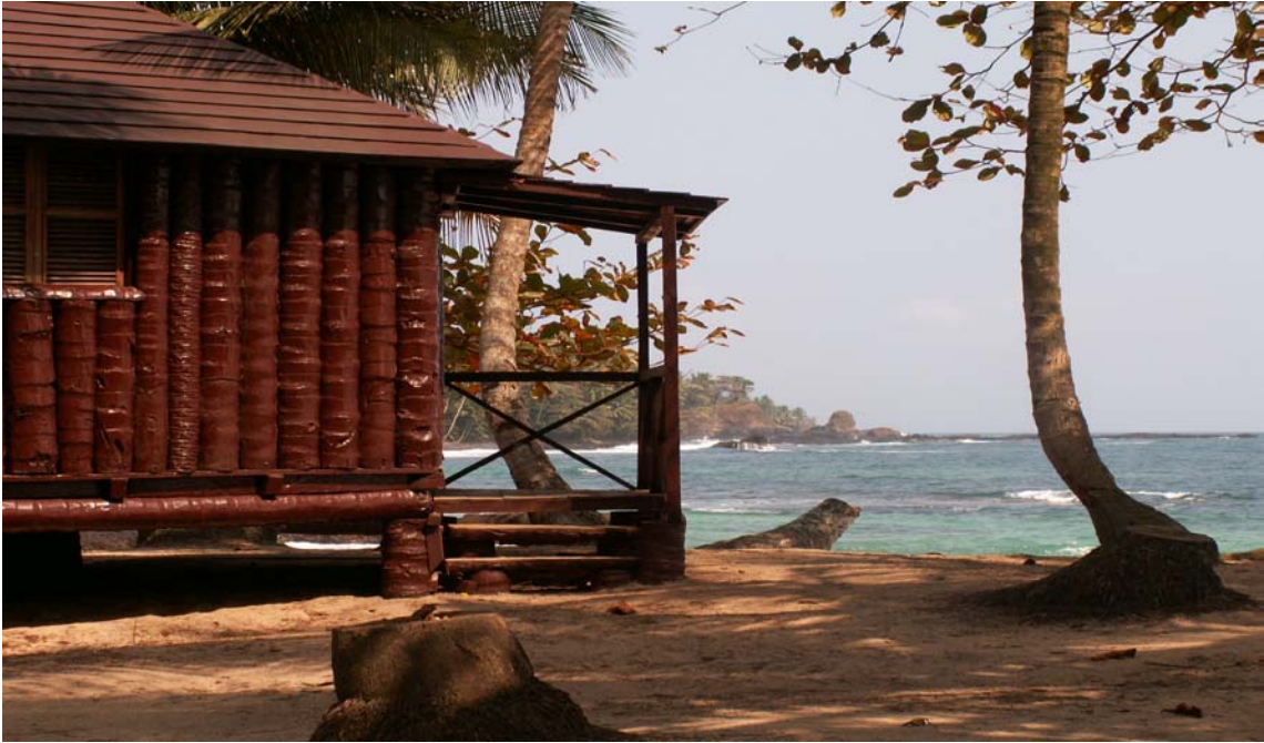
Eco lodge à Praia Jale