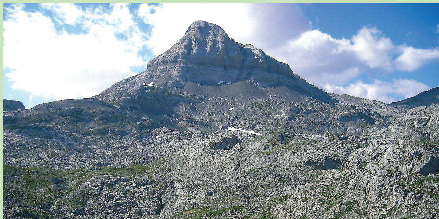
Le Pic d'Anie

Une randonnée totalement dépaysante dans un milieu exceptionnel principalement constitué d'un plateau rocheux profondément crevassé. Jamais pourtant cette minéralité n'opresse, car la roche aux teintes chaudes capte comme nulle autre les lumières, car elle abrite au fond de ses entailles une vivante foule de petits végétaux colorés. Du sommet, sous le vol des chocards familiers, la vue embrasse l'immensité de ce dédale rocheux et se prolonge bien au au-delà.