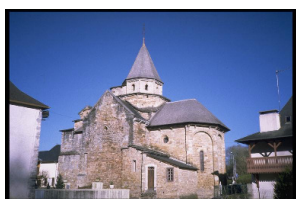
Eglise de l'Hôpital Saint Blaise

Magnifique introduction à votre voyage sur les coteaux de Moncayolle, et traversée de la forêt des Arambeaux jusqu'au bourg de Barcus, puis poursuite vers Tardets par le vallon de Gaztelondo et le village de Montory.