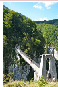
La passerelle d'Holtzarte

Dîner et nuit à l'hôtel** Etchemaïté, Logis de France 3 cheminées.