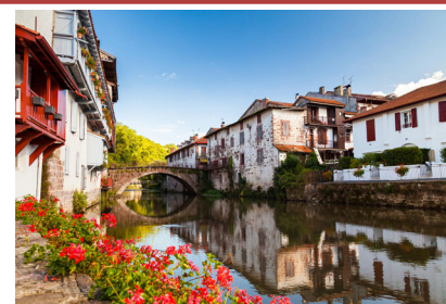
Saint Jean Pied de Port