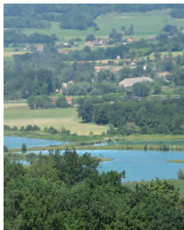
Le lac des Barthes de Biron